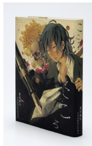
東京装画賞 銅の本賞 (秋山孝ポスター美術館長岡賞) (学生部門) 『ころ』緑川彩乃 (東京工芸大学)