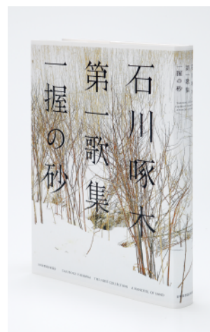
東京装画賞 銅の本賞 (秋山孝ポスター美術館長岡賞) (一般部門) 『一握の砂』日下潤一 / 上清涼太