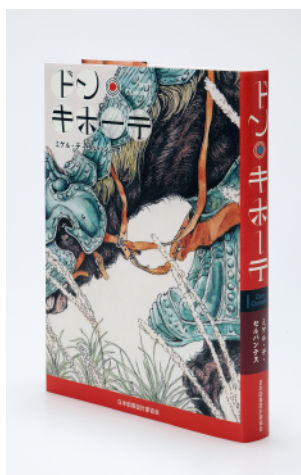
東京装画賞 銀の本賞 (日清紡ペーパープロダクツ賞) (一般部門) 『ドン・キホーテ』テッポー・デザイン