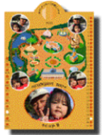
記念フォトスタンドカード Memorial photo-stand card