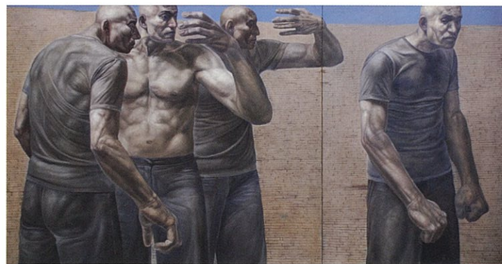
松村浩之 マツムラ・ヒロユキ 「壁」 キャンバス、油彩 162.0×306.0cm 2010年