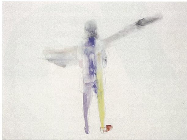
澤田明子 サワダ・アキコ 「ヒアII」 麻紙、胡粉、岩絵具 194.0×259.0cm 2010年

8 March (thu) - 23 March (fri), 2012 10:00 - 18:00 (admittance until 17:30) Closed on 13 March (tue) Admission free