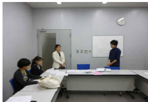
経験者さんがポイントを教えてくださいました！

参加して下さったみなさん。お疲れさまでした♪ これからも、どうぞよろしくお祈いします。 また、今回残念ながら参加できなかった方や、これを機にやってみたいと思って下さったみなさん。 ぜひ、またの機会にご参加ください(*^o^*)