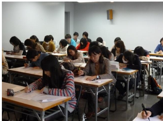
初心者さんもよくテイクできていました

参加して下さったみなさん。お疲れさまでした♪ これからも、どうぞよろしくお願ひします。 また、今回残念ながら参加できなかった方や、これを機にやってみたくお願ひして下さったみなさん。 ぜひ、またの機会にご参加ください(*^o^*)